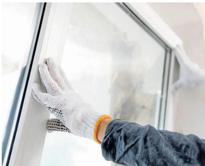
Ein Fensteraustausch lohnt sich immer.

Glötzer GmbH Dörntener Straße 25, GS-Baßgeige (05321) 37340