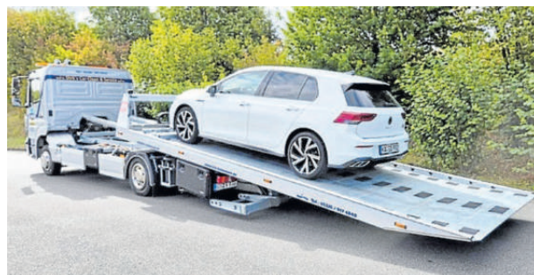
Der große Abschlepper „Sylvester“.

reinigung zur Fahrzeugaufbereitung bis zum neuesten Angebot: Mit dem Oxhydro Carbon Cleaner ist es, stark vereinfacht gesagt, mit Hilfe der Py-