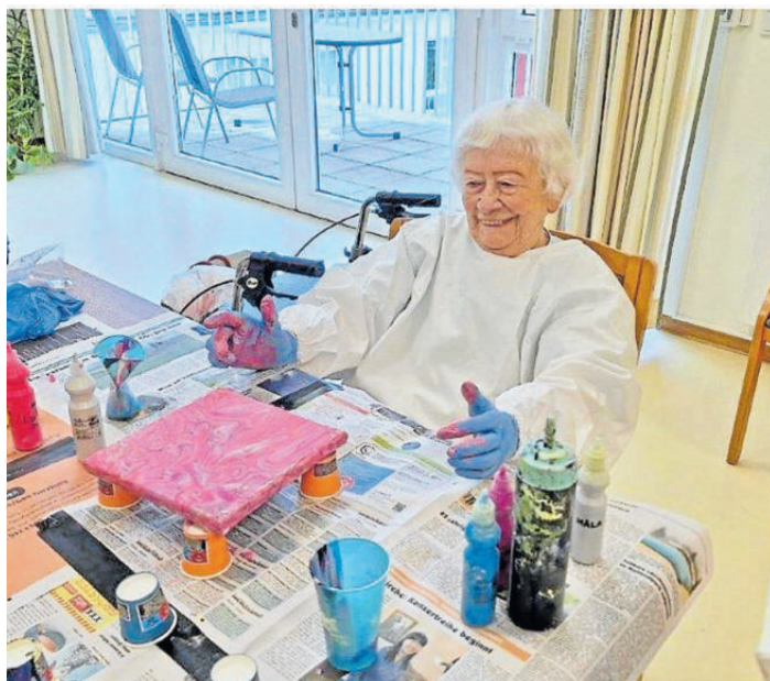
Die Kreativrunde mit Acrylgießen..