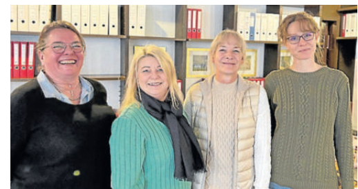
Das Team von Brünniger + Hauk.

Unverbindliche, kostenlose Vor-Ort-Termine, um das Objekt vernünftig einordnen zu können, sind eine Selbstverständlichkeit. „Eine unserer Stärken ist unsere ausgeprägte Orts-