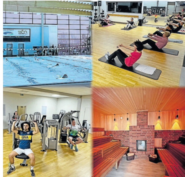
Das Aquantic bietet viele Möglichkeiten.

AQUANTIC Schwimmpark am Osterfeld Osterfeld 11, Goslar Tel. (0 53 21) 7 58 20 www.aquantic.de