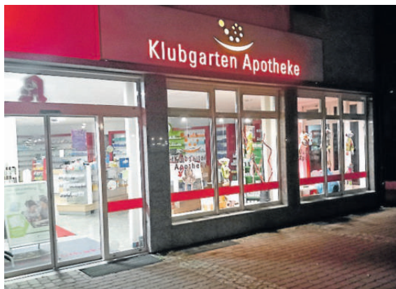
Die Klubgarten-Apotheke im Notdienst.