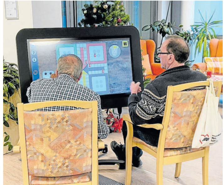
Der Care-Table der Tagespflege in Aktion.

digitalen Spiel- und Medientisch. Gemeinsam kann man zum Beispiel Bingo, Mensch-ärgere-Dich-Nicht, Memory oder auch Geschicklichkeitsspiele spielen. Ein*e Mitarbeiter*in ist bei der richtigen Auswahl behilflich und kümmert sich dabei um die benötigten Einstellungen am Gerät. Begleitet wird alles durch die allseits beliebte „Cappuccino-/Teerunde mit Keks“, um die Zeit bis zum eigentlichen Kaffee ab 15 Uhr zu überbrücken.