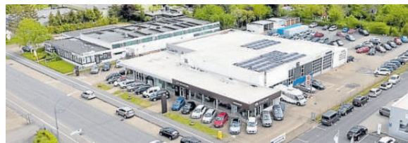
Heinemann in Goslar.

HEINEMANN Gruppe GmbH Autoservice in Goslar Bornhardtstr. 8, Goslar Tel. (0 53 21) 37 18 10 www.heinemann-gruppe.de