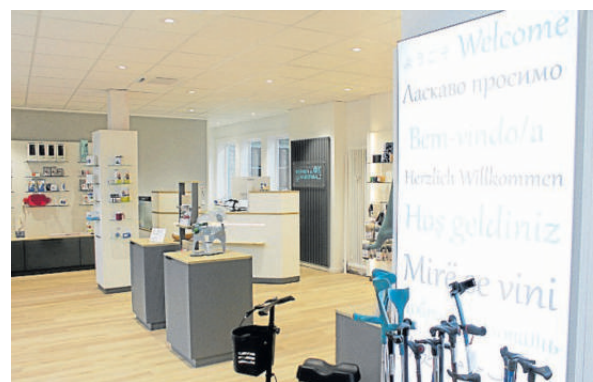
Der neue Eingangsbereich.